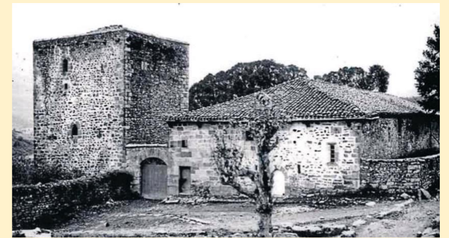
PROAÑO.- LA CASONA