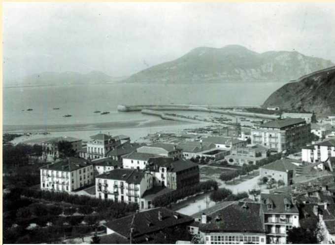
VISTA PANORÁMICA DE LAREDO

propietario de los fondos fotográficos y vocacionalmente dedicado a los estudios históricos y de las artes, y por la Federación Acanto, que agrupa a una serie de asociaciones que tienen como objetivo común la defensa del patrimonio cultural, arquitectónico, artístico y natural. La coordinación de ambas entidades permite disponer hoy de esta obra excepcional, con la que se rinde homenaje a su autor al cumplirse el centenario de la exposición que se celebró en el Ateneo de Santander. El reconocimiento a Fernando Cevallos se verá completado con una exposición de sus