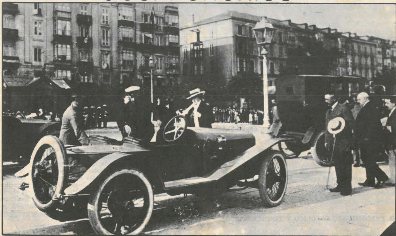
SS. MM. los Reyes, a su regreso de unas regatas, son recibidos por el alcalde don Pedro San Martín, que aparece en la fotografía con sombrero y bastón en la mano.