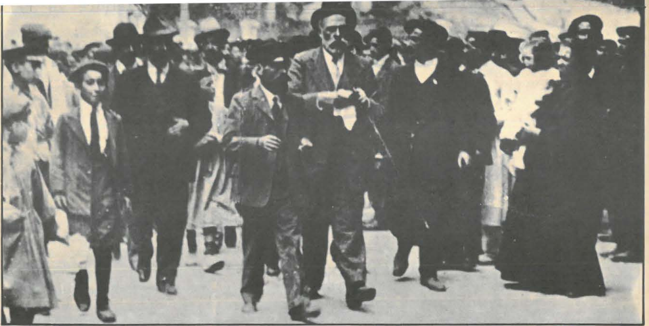
El Jefe del Partido Socialista, Pablo Iglesias, después del mitin celebrado en 1904 en la Plazuela de Numancia.