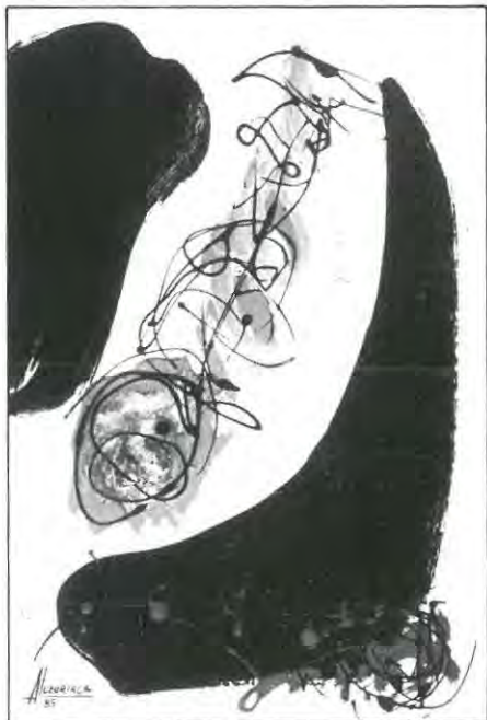
La pintura de Luzuriaga sale del subconsciente.

Su pintura sale del subconsciente y busca reproducir la emoción a través de la belleza plástica de unas formas de expresión artísticas en las que el color es combinado de tal manera que el espectador encuentra en ellas, en ocasiones, simbolismos o analogías con figuras rea-