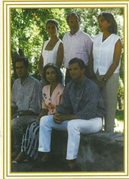
LA FAMILIA REAL FINALIZA SUS VACACIONES