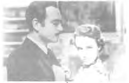
Fotograma de "La loca de la casa", 1950.

Parece obligado preguntarnos los años de cine que pudo aprovechar el escritor y la repercusión que tuvo su ceguera en la asistencia a esta clase de espectáculos. Indudablemente, el novelista debió de acudir, como otros muchos escritores, a las primeras muestras de este arte que, era, al fin y al cabo, una narrativa con imágenes. Otra cuestión es si fue mucho o poco al cine y si se sintió atraído por él.