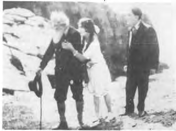
Fotograma de "El abuelo", 1925.

Era fácil advertir las grandes diferencias del cine respecto al teatro, en cuanto que permitía la mezcla de realidad y fantasía, la transformación de personajes y la expresión sólo con el gesto, sin necesidad de la palabra. Por otro lado, los escenarios podían ser naturales y, por supuesto, más amplios