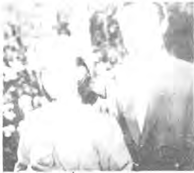
Fotograma de "Marianela", 1940.

que los del teatro. Sin embargo, no existía la comunicación directa y viva del actor con el público.