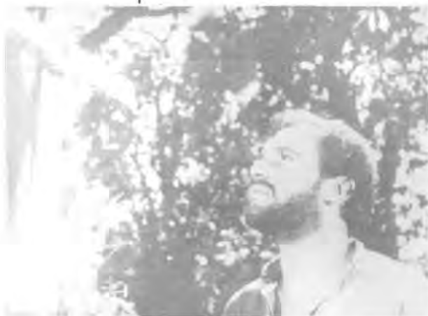
Fotograma de “Nazarín”, 1958.

Como si fuera una premonición, Pérez Galdós había tratado con especial ternura a los ciegos en sus obras, de lo que dio muestras en “ Marianela ” (1878), “ Misericordia ” (1897) y en “ El abuelo ” (1904).